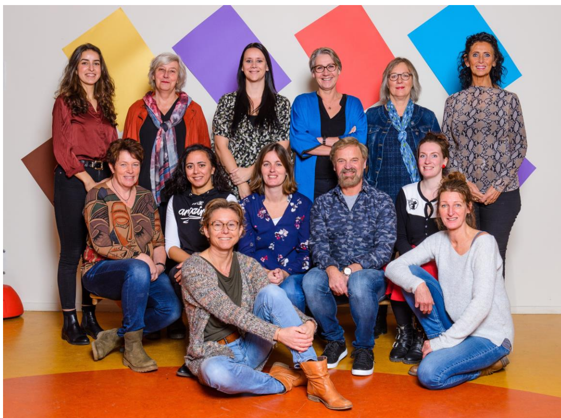
Team schooljaar 2019-2020